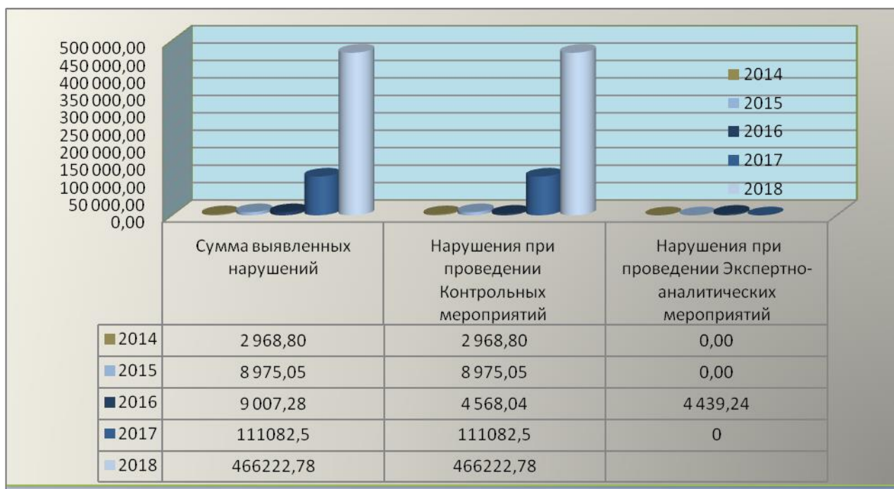
Диаграмма 3. Сумма выявленных нарушений при проведении контрольных и экспертно-аналитических мероприятий.

По итогам контрольных мероприятий выявлено нарушений исполнения законодательства на сумму 466 222,78 тыс. рублей из них в соответствии с классификатором нарушений: