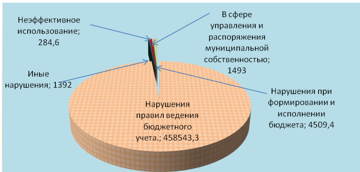
Диаграмма 4. Структура выявленных нарушений тыс. рублей

Сведения о мерах, принятых по результатам контрольных мероприятий