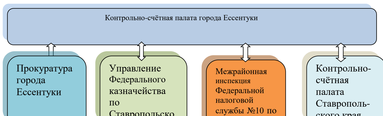
Диаграмма 5. Соглашения о взаимодействии

В этой связи, Контрольно-счетной палатой заключены соглашения о сотрудничестве с прокуратурой города Эссентуки, Управлением Федерального казначейства по Ставропольскому краю, Контрольно-счётной палатой Ставропольского края (далее – Соглашения), с Межрайонной инспекцией Федеральной налоговой службы №10 по Ставропольскому краю.