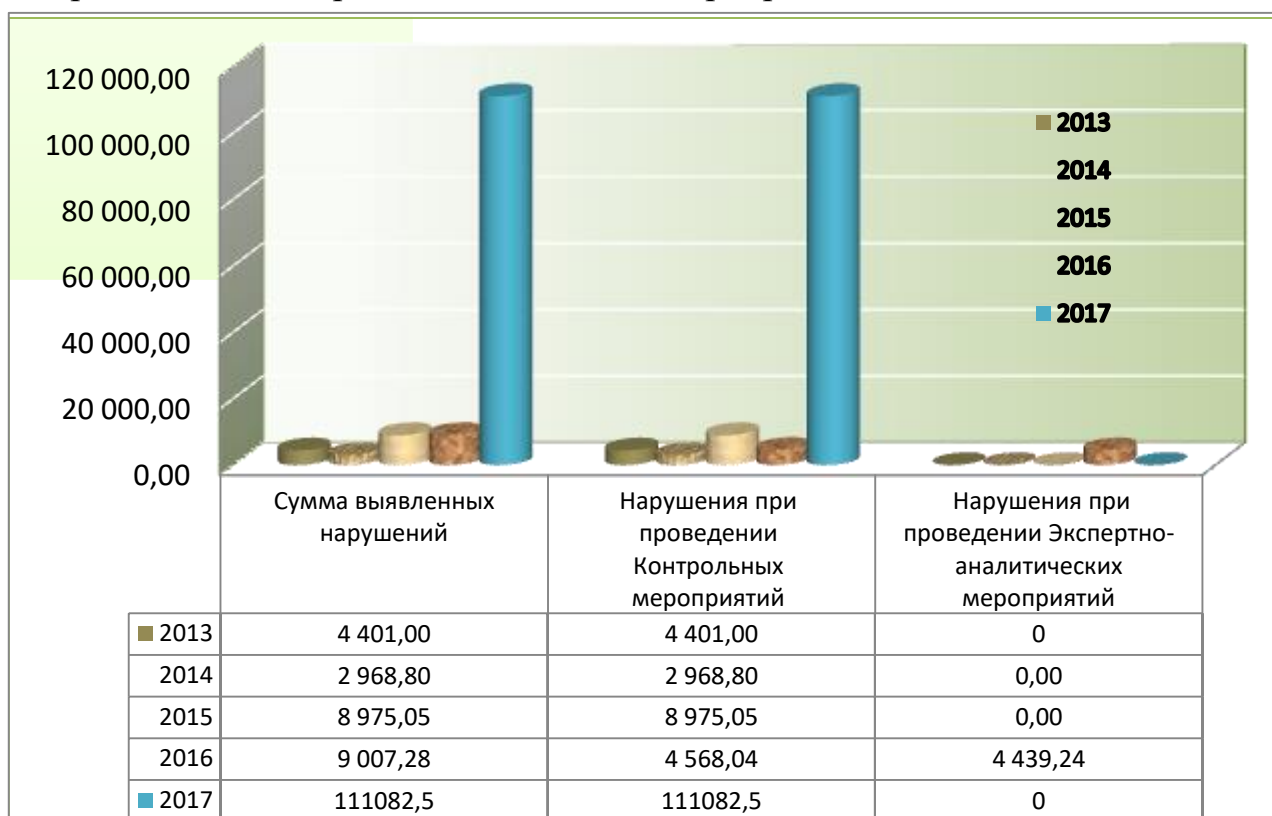
Диаграмма 2. Сумма выявленных нарушений при проведении контрольных и экспертно-аналитических мероприятий.

По итогам контрольных мероприятий выявлено нарушений исполнения законодательства на сумму 111 082,50 тыс. рублей из них в соответствии с классификатором нарушений: