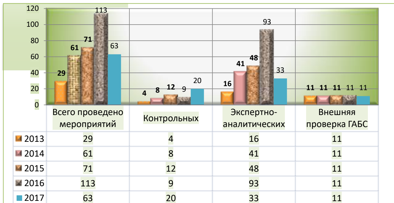
Диаграмма № 1 Количество проведённых контрольных и экспертно-аналитических мероприятий в 2017 году в сравнении с 2013-2016 годами.

Проверками охвачены подконтрольные объекты, получающие средства из бюджета города Эссентуки, т.е. кроме проведения контрольных и экспертно-аналитических мероприятий, ежегодно проверке подвергаются годовые отчёты об исполнении бюджета одиннадцати главных распорядителей бюджетных средств города Эссентуки.