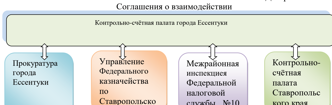
Диаграмма № 5.

В этой связи, Контрольно-счетной палатой заключены соглашения о сотрудничестве с прокуратурой города Эссентуки, Управлением Федерального казначейства по Ставропольскому краю, Контрольно-счетной палатой Ставропольского края (далее – Соглашения), с Межрайонной инспекцией Федеральной налоговой службы №10 по Ставропольскому краю.