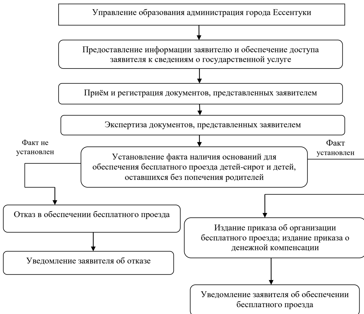
Блок-схема предоставления государственной услуги

Приложение 2 к Административному регламенту предоставления управлением образования администрации города Обеспечение бесплатного проезда детей-сирот и детей, оставшихся без попечения родителей, находящихся под опекой (попечительством), на городском, пригородном, в сельской местности на внутрирайонном транспорте (кроме такси), а также бесплатного проезда один раз в год к месту жительства и обратно к месту учебы»