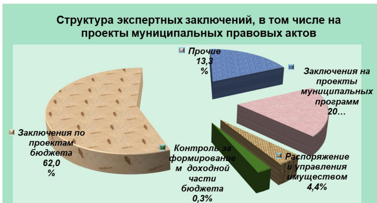
Диаграмма № 3

Сумма выявленных нарушений при проведении контрольных и экспертно-аналитических мероприятий