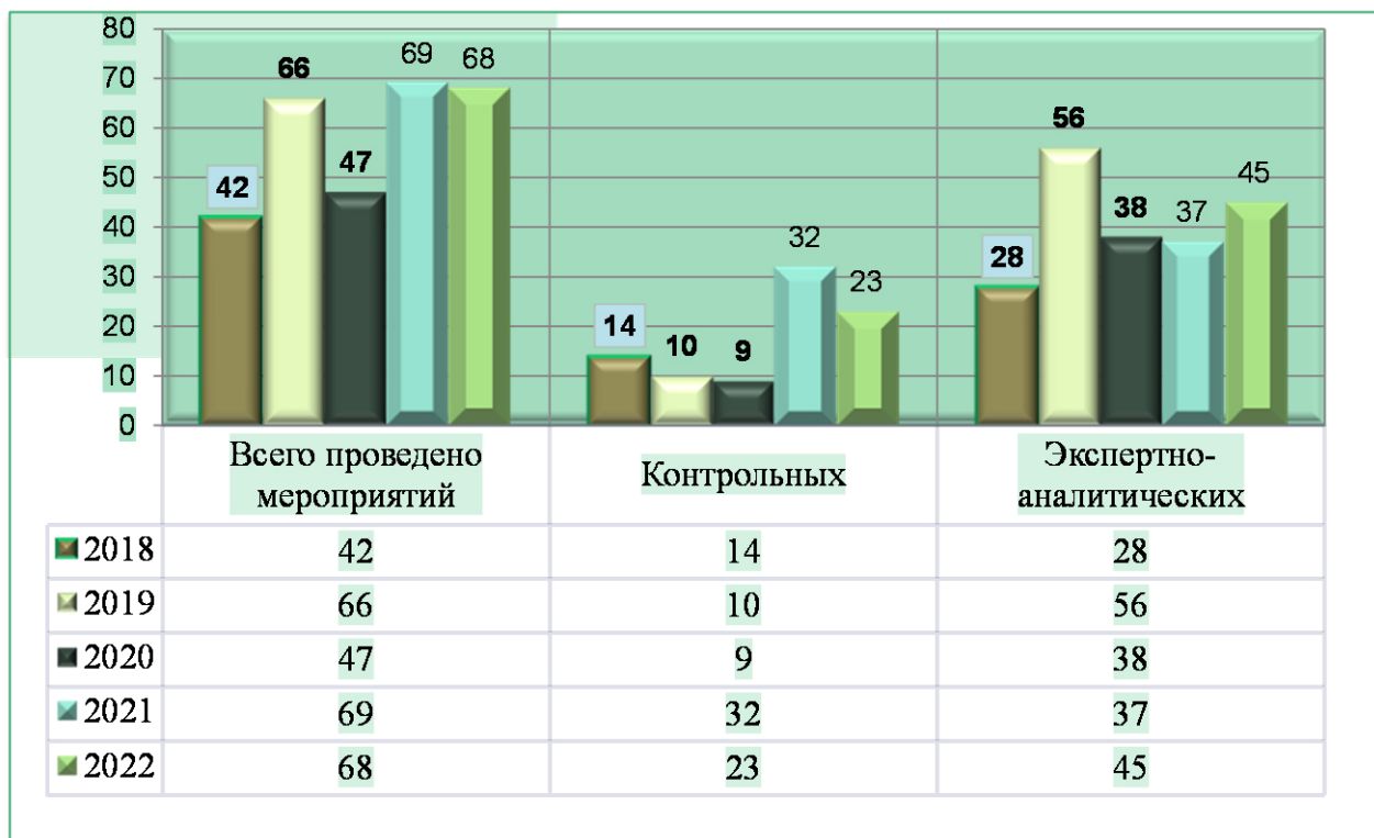
Количество проведённых контрольных и экспертно-аналитических мероприятий в 2022 году в сравнении с 2018-2021 годами