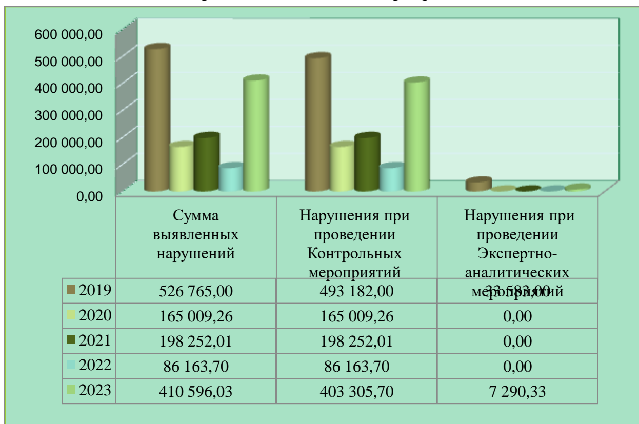
Сумма выявленных нарушений при проведении контрольных и экспертно-аналитических мероприятий