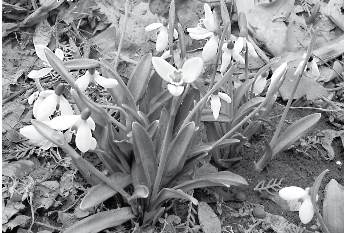
В ожидании весны...