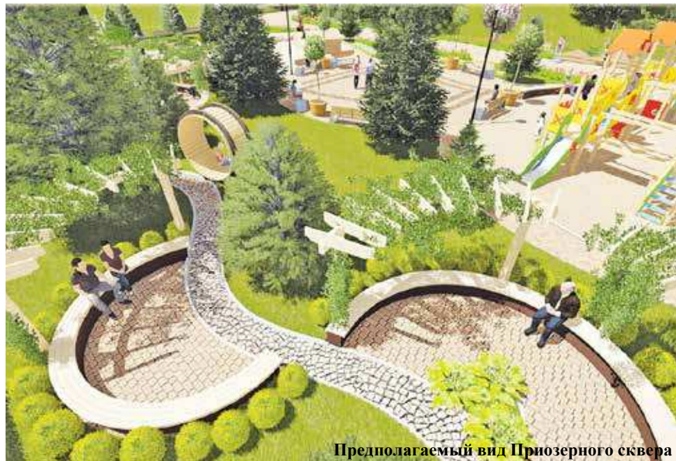
Предполагаемый вид Приозерного сквера

P.S. Протокол и точные цифры голосования см. на стр. 2.