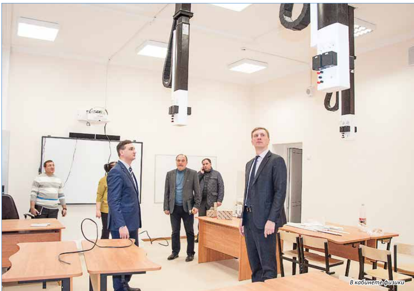
В кабинете физики

Подготовила Анна БЕЛОУСОВА