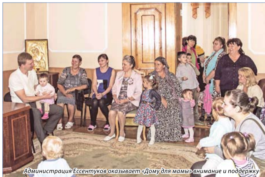
Администрация Ессентуков оказывает «Дому для мамы» внимание и поддержку

Сегодня «Дом для мамы», к сожалению, очень востребован. Трех сотням подопечных здесь помогают регулярно, а еще есть разовая поддержка. В кризисном центре оказывается комплексная помощь. Здесь могут одновременно приютить пять-семь мам с детьми. Есть склад гуманитарной помощи, бесплатные консультации юриста, педагога-