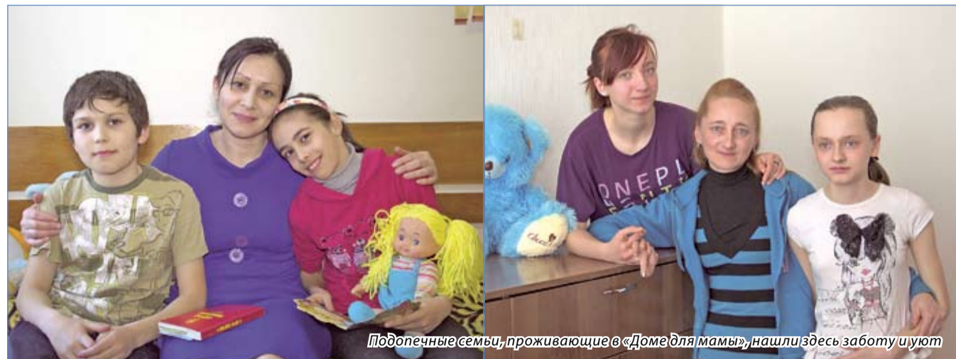
Подопечные семьи, проживающие в «Доме для мамы», нашли здесь заботу и уют

Администрация Ессентуков постоянно помогает «Дому для мамы». Глава города Александр Некристов посещает центр, общается с подопечными и оказывает всевозможную поддержку.