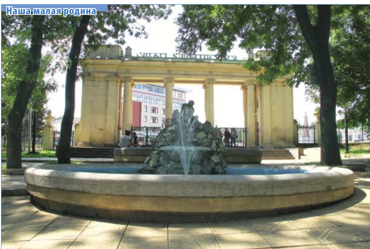
Еще несколько дней – и в город придет весна!