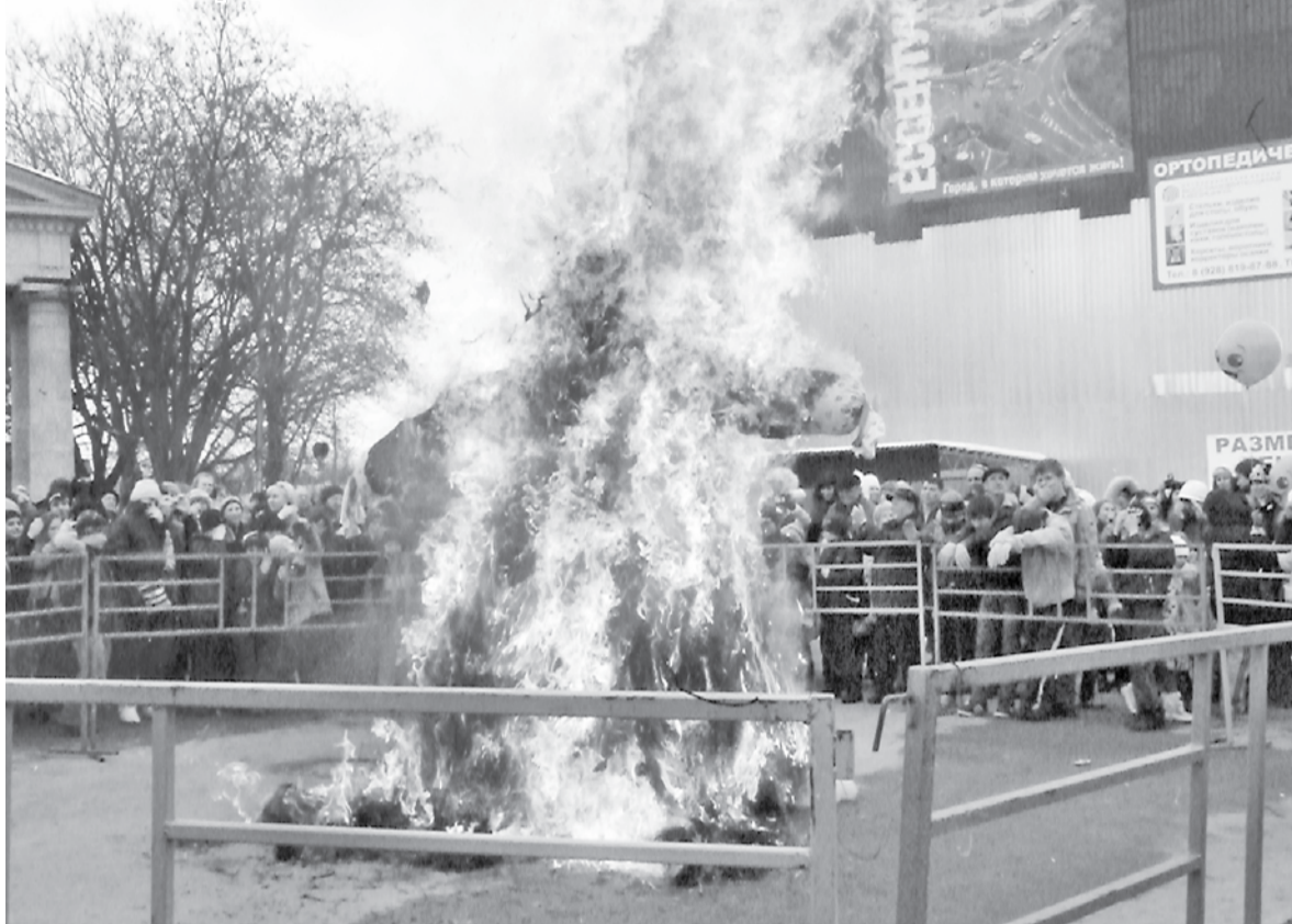
В последний день Масленицы на Театральной площади сожгли чучело Зимы