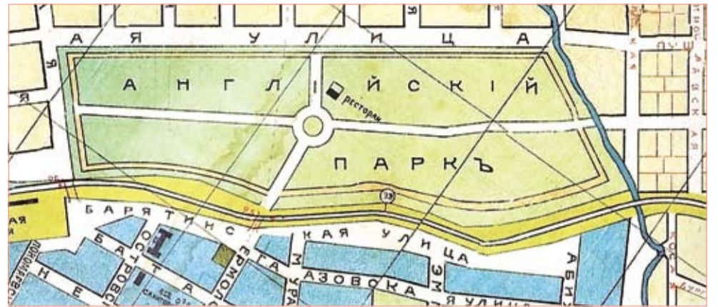
Фрагмент карты Ессентукского курорта (1915 г.)

6 мая 1972 года в центре парка был открыт мемориал в память о погибших в годы Гражданской и Великой Отечественной войн