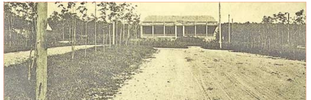
Казенный ресторан на главной аллее Английского парка (около 1915 г.)