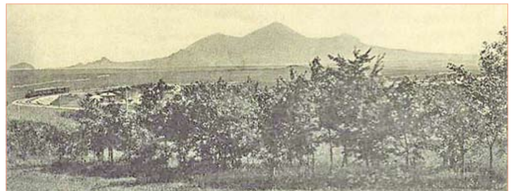
Вид из Английского парка на гору Бештау (около 1910 г.)