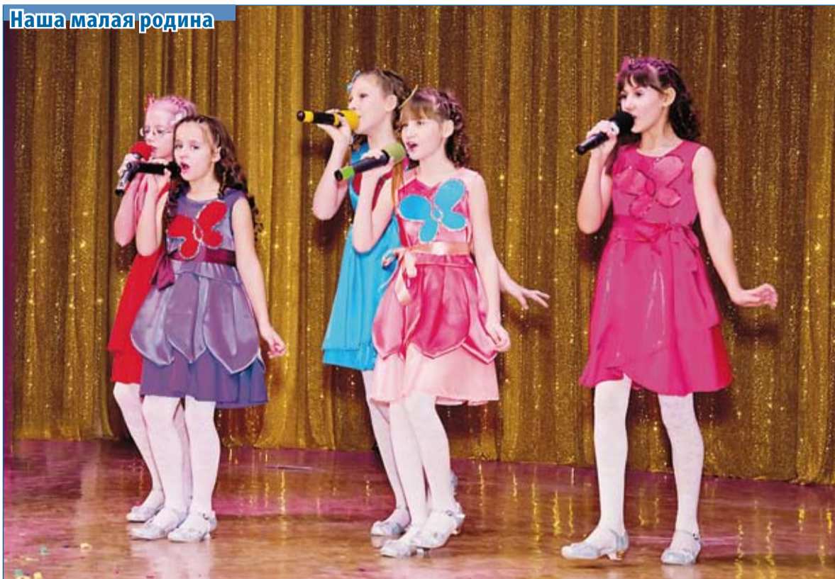
Ансамбль «Конфетти» из Астрахани на фестивале «Голос России»