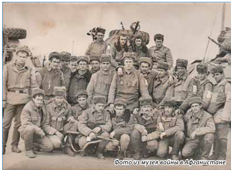
Фото из музея войны в Афганистане

военный, офицер по долгу службы был направлен воевать в далекую для советских граждан страну. Принимал участие в боях в качестве арт-корректировщика. Через полтора года получил тяжелое ранение. После долгого лечения пе-