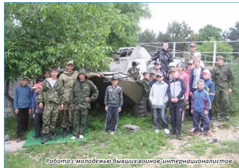
Работа с молодежью бывших воинов-интернационалистов

Кропотливая и ответственная патриотическая работа дала свои результаты – благодаря усилиям Союза ветеранов Афганиста-