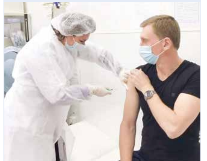
Глава Ессентуков Александр Некристов:

— После первого компонента вакцины испытывал легкое недомогание, которое на следующий день исчезло. В ближайшие дни иду на второй этап вакцинации. Напоминаю, что вакцинация добровольная и бесплатная.