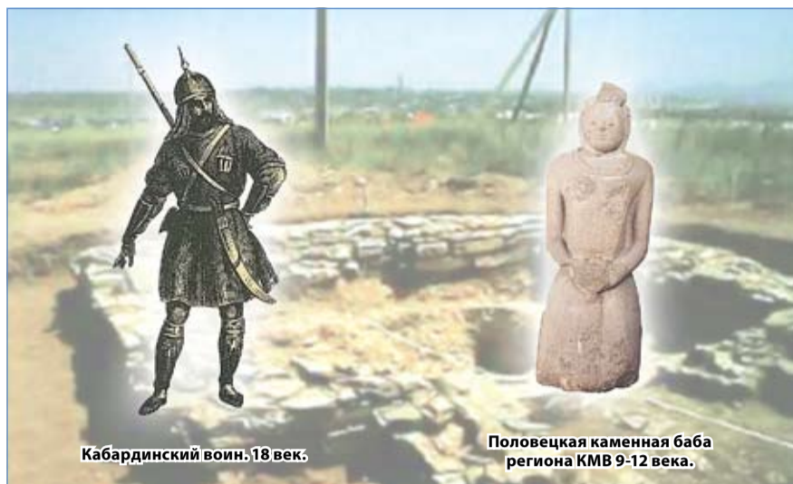
Кабардинский воин. 18 век.

После на территории Ессентуков обосновались ираноязычные аланы. Аланский могильник обнаружен у станции Белый Уголь. С VI века через наши места проходила трасса «Миссимианского отрезка» Великого Шелкового пути. Именно на территории Ессентуков она разветвлялась – одна дорога шла на восток по долине Подкумка, другая уходила на север, к Манычу. К VIII веку алан вытеснили тюрки-болгары из Хазарского каганата. Видимо, Хазария решила взять