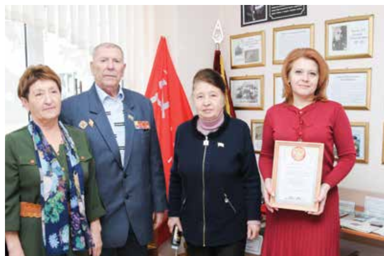
Школьный музей, который по достоинству оценили на краевом уровне, действительно впечатляет. В нем собрана