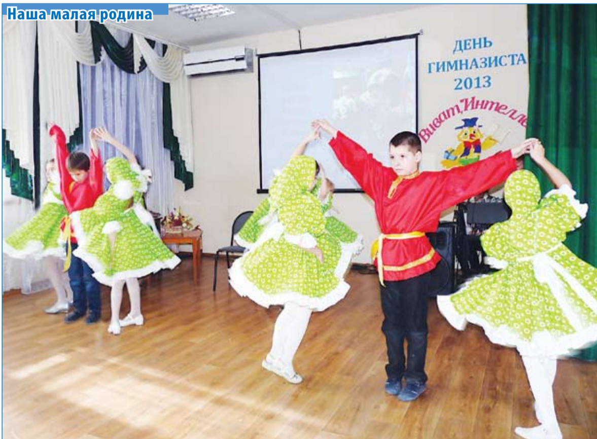
Юные танцоры гимназии «Интеллект» на юбилейном концерте. Читайте стр. 5.