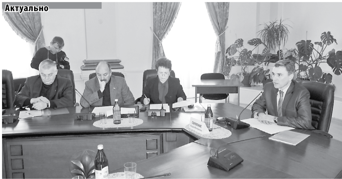
Министр курортов и туризма СК А. В. Скрипник (справа) на встрече в администрации города