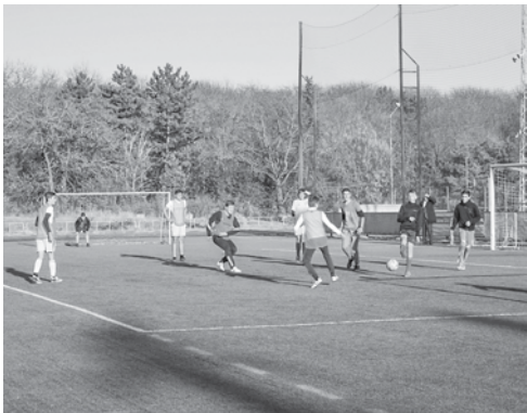
Подготовила Анна БЕЛОУСОВА

Среди главных задач, которыми будет заниматься федерация, – консолидация и развитие дворовых команд, детского футбола, ветеранского спортивного движения, участие сборной города в первенстве края в 2019 году. Также эссентукская федерация футбола готова выступить с инициативой о проведении в городе крупных общероссийских спортивных соревнований.