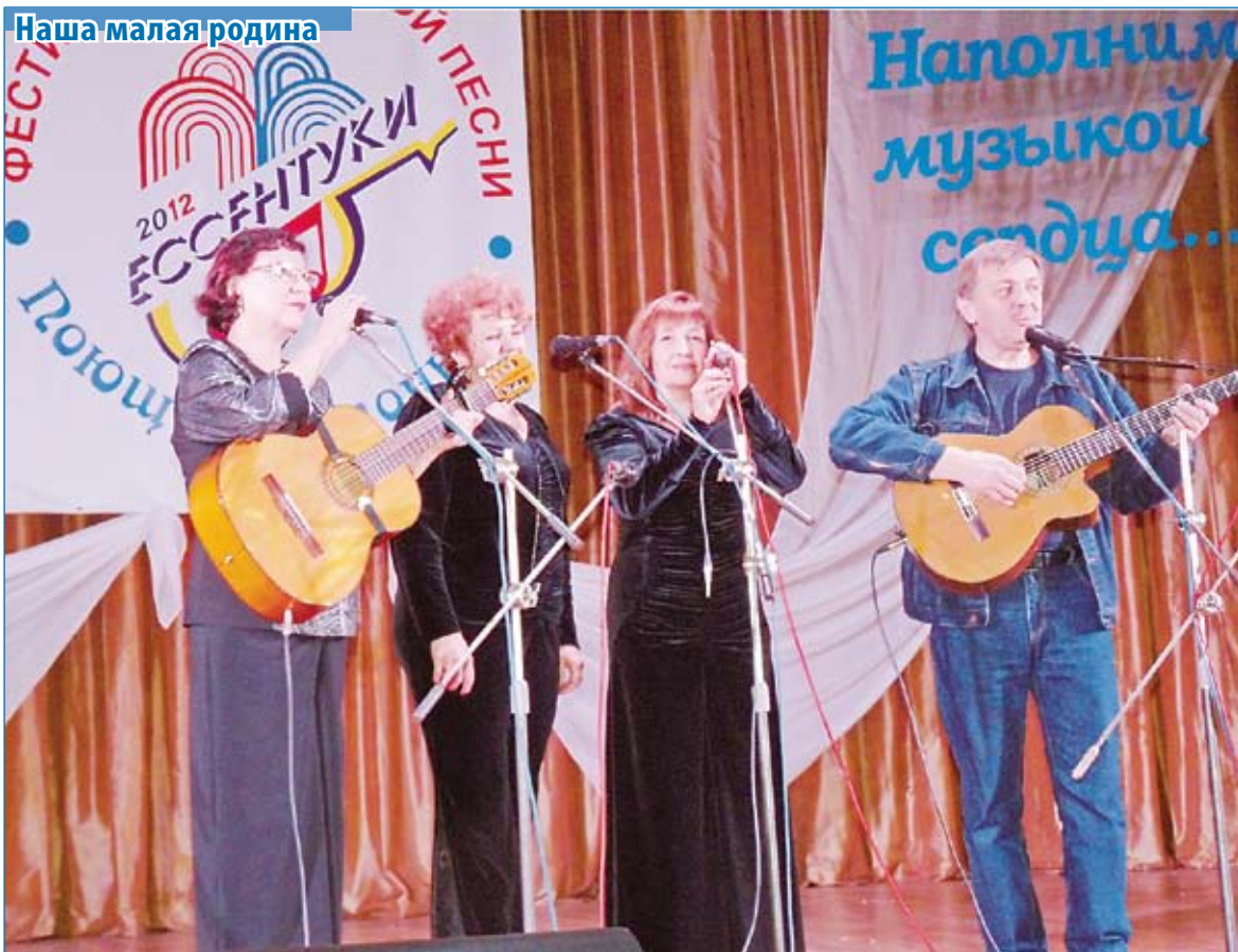
Обладатели гран-при 11-го фестиваля «Поющий источник» – ансамбль «3-1»