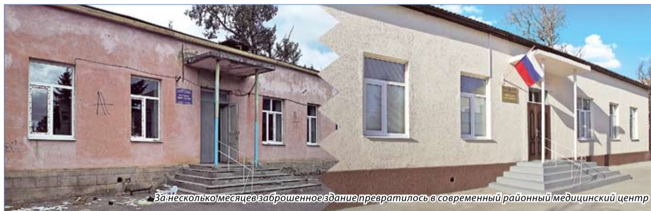
За несколько месяцев заброшенное здание превратилось в современный районный медицинский центр

Три года жители Белого Угля были лишены возможности посетить врача в собственном районе. Без медобслуживания остались и семьи, проживающие в микрорайоне Южном, всего более шести тысяч человек.