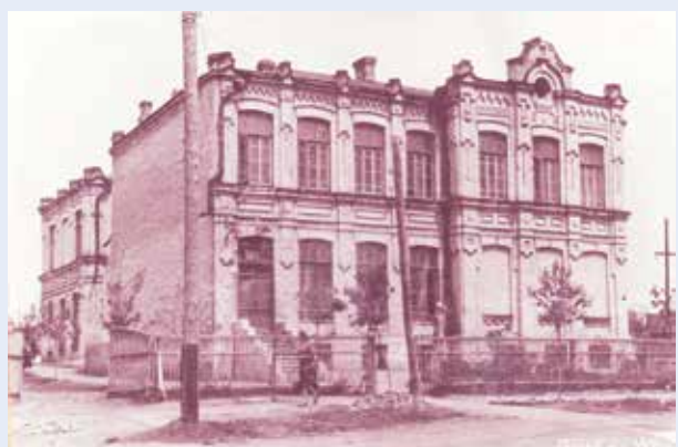
Здание школы с 1914 года на ул. Пушкина, 58. Построено на средства Терского казачьего войска.

А в 1995-м для МОУ СОШ № 1 было выстроено новое здание на улице Вокзальной, где она находится и по сей день.