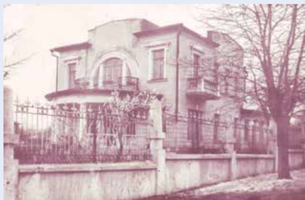
Ессентукская мужская прогимназия (1912 год), первая средняя школа на ул. Свердлова, 1.