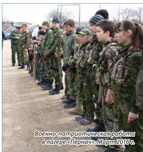
Военно-патриотическая работа в лагере «Пернач». Март 2016 г.

Сейчас разрабатываются и решаются вопросы юридического характера, как грамот-