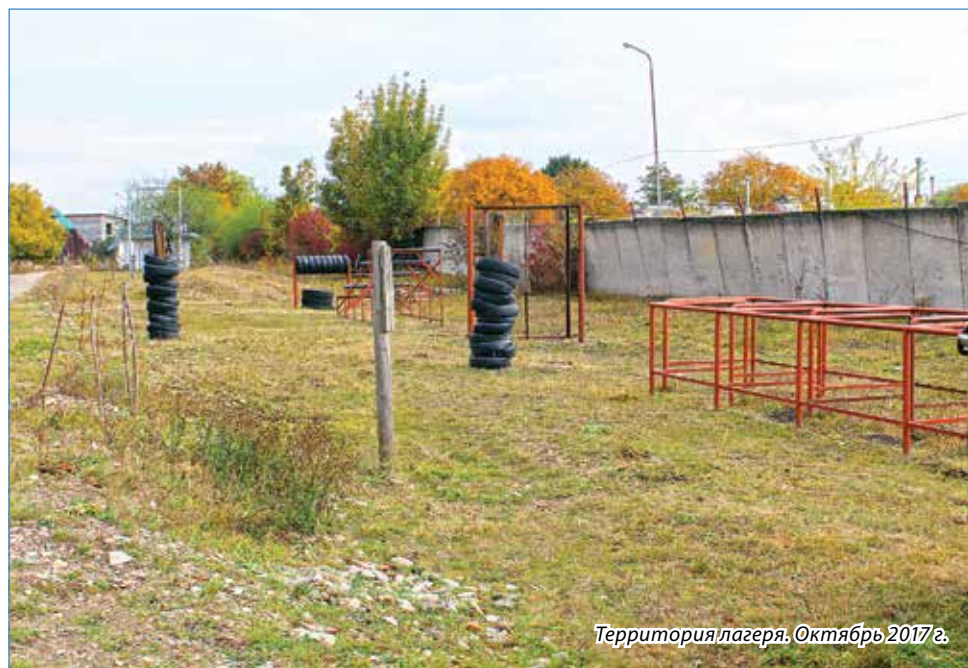
Территория лагеря. Октябрь 2017 г.

– Считаю, что это должно быть тройственное соглашение между казачеством, епархией и воинами-интернационалистами,