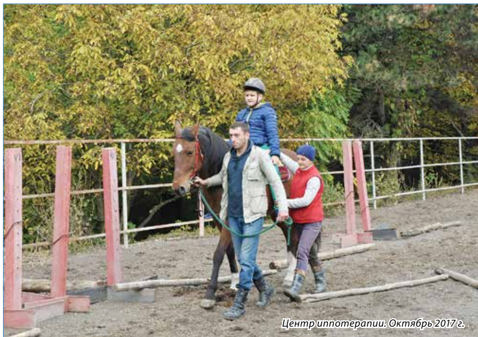
Центр иппотерапии. Октябрь 2017 г.

Анна БЕЛОУСОВА