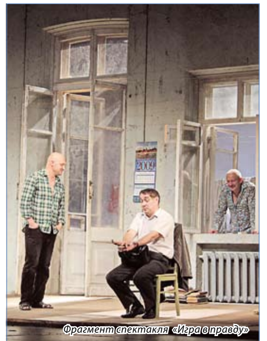
Фрагмент спектакля «Игра в правду»

– Нет, наверное... Есть расхожая фраза, что каждый актер мечтает сыграть Гамлетом. Его мне никогда не хотелось сыграть. Очень давно нравился Тибальт в «Ромео и Джульетте», когда еще возраст позволял. Был интересен этот персонаж – он такой дерзкий. Очень давно, еще в школе, обожал роман «Тихий Дон» и, конечно, хотелось сыграть Григория... А сейчас, когда сам пишешь сценарий, – вот это идеально! Сам себе придумываешь роль, сюжет. Поэтому сыграть такую роль очень интерес-