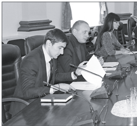
На очередном заседании межведомственной комиссии были заслушаны представители предприятий-должников.

Члены комиссии выявляют неплательщиков, официально уведомляют о необходимости погасить долги, ведут с ними разъяснительную работу, оказывают при необходимости консультации. А если никакие доводы не действуют, на нерадивых руководителей подают в суд. В этом случае взыскание долгов проходит в принудительном порядке с арестом счетов и имущества. Не исключено и возбуждение уголовного дела.