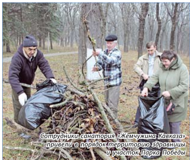
Сотрудники санатория «Жемчужина Кавказа» привели в порядок территорию здравницы и участок Парка Победы

Коллектив санатория «Виктория» активно потрудились на своем участке накануне, а вот сотрудники «Жемчужины Кавказа» поучаствовали в общегородском субботнике дважды – убрав закрепленную за собой территорию в пятницу, а на следующий день приведя в порядок участок парка.