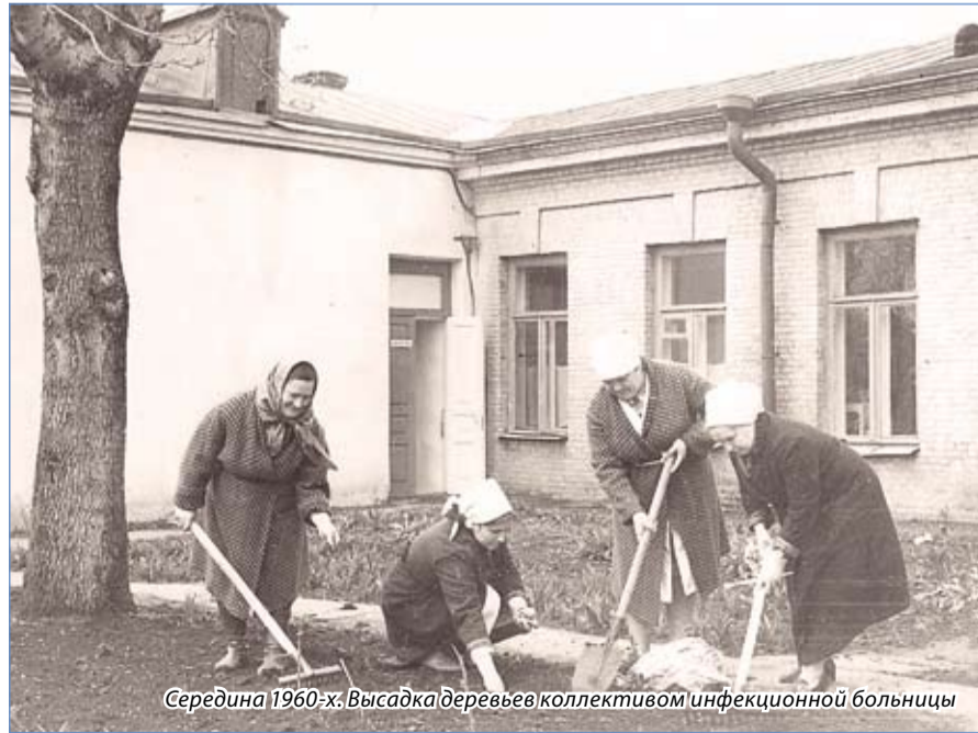
Середина 1960-х. Высадка деревьев коллективом инфекционной больницы

Изначально в больнице были детские и взрослое отделения и лаборатория.