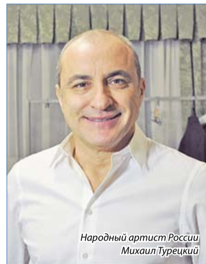
Народный артист России Михаил Турецкий

– С юбилейной программой «Лучшее» мы планируем объехать всю