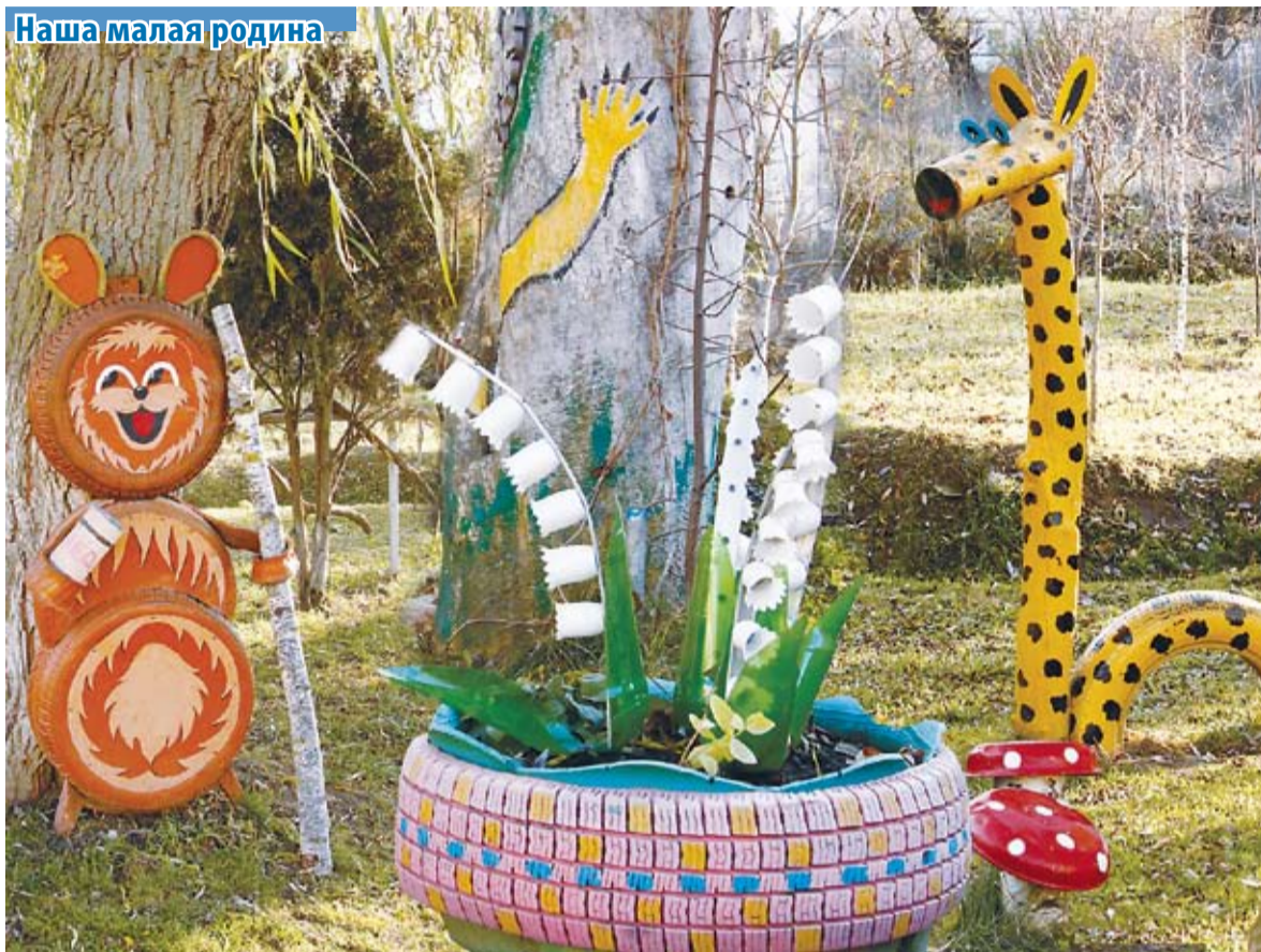
Оригинальные украшения переулка Ясного / коллаж Сергея ПИРОГОВА из фото Ульяны ЯКОВЕНКО