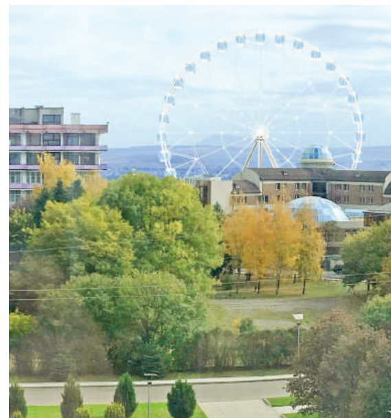
Предполагаемый вид колеса обозрения

В Парке Победы начался демонтаж колеса обозрения. Старая конструкция сейчас распиливается по деталям, уже частично срезаны сваркой кабинки, после чего несущие элементы будут также удалены. Процесс продлится около месяца. Тем временем на территории готовится к реализации новый и современный инвестпроект.