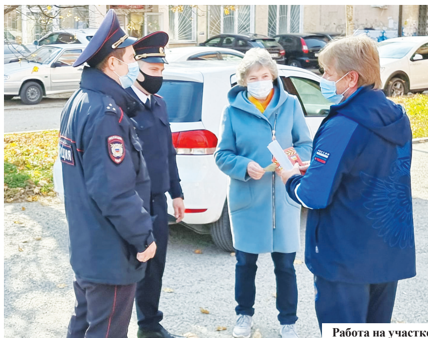
Работа на участке