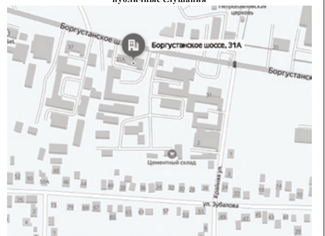
Схема с указанием территории, в отношении которой проводятся публичные слушания