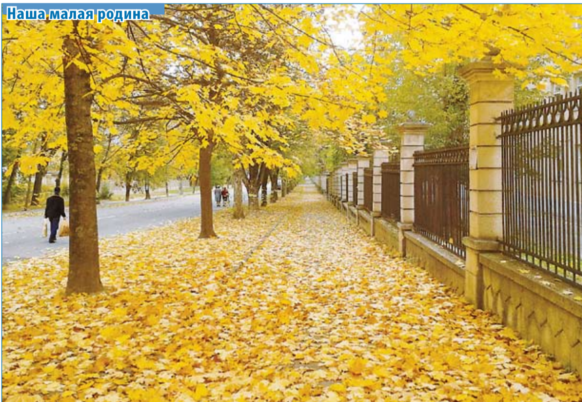
Золотая осень. Ессентуки, улица Семашко