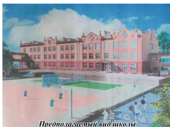
Предполагаемый вид школы

Глава Александр Некристов подчеркнул, что в Ессентуках готовятся проектно-сметные документы ещё на 4 школы для проведения капремонта в 2023 году. Экспертизу о необходимости ремонта готовят все школы Ессентуков.