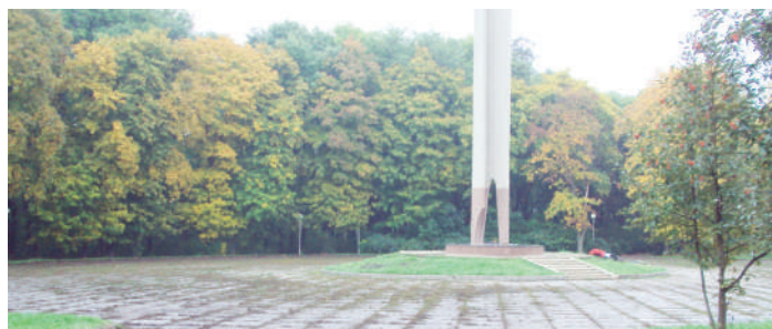
Было. 2009 год

725 памятников воинской славы находятся на Ставрополье, из них 480 имеют статус объектов культурного наследия, в ремонте нуждаются около 250 — такие данные были приведены Контрольно-счетной палатой региона на заседании комитета краевой Думы по образованию, культуре, науке, молодежной политике, средствам массовой информации и физкультуре. К 75-летию Великой Победы независимо от правового статуса все памятники Ставрополья будут приведены в порядок, отреставрированы, обновлены информационные надписи. В Эссентуках эта работа уже проведена.