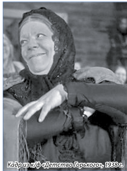
Кадр из к/ф «Детство Горького», 1938 г.

Варвара Осиповна была уникальной актрисой. Не просто интуитивно входила в роль, а анализировала и создавала ее. Она обладала фантастической способностью, оставаясь органичной, используя одни и те же внешние данные, создавать прямо противоположное. Но в каждой из ролей она остается актрисой той самой реалистической школы, в которой нет никаких преувеличений, никакой эксцент-