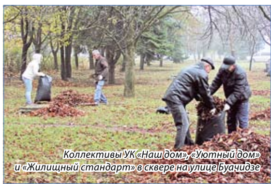
Коллективы УК «Наш дом», «Уютный дом» и «Жилищный стандарт» в сквере на улице Буачидзе

Осеннее субботнее утро. За окном ветер и дождь, холод и опадающая листва. В такое время больше всего хочется тепла и уюта. Ан нет, ессентучане – не из неженки! Горожане организованно вышли на улицы навести чистоту и порядок.