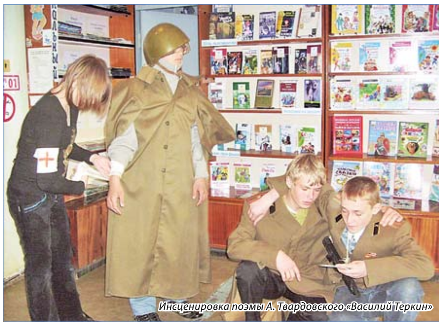
Инсценировка поэмы А. Твардовского «Василий Теркин»

В библиотеке-филиале № 5 состоялся хронограф «А память нам покоя не даст» для учащихся старших классов школы № 5. Ребята узнали о героях