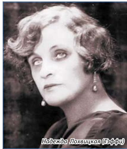
Надежда Лохвицкая (Тэффи)

ла «Рассказов для выздоравливающих». Выступая когда-то на сцене «Театра-парка», он говорил: «В Ессентуках промывают желудки, и человек рождается заново. Вот бы найти курорт, где промывают мозги, человек и жил бы дольше».