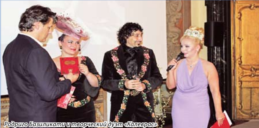
Родриго Базиликати и творческий дуэт «Калеврас»

Ессентучане изготовили для кумира подарочный диск с авторскими песнями на французском и итальянском языках. Дуэт «Калеврас» произвел огромное впечатление на племянника Кардена, и он пообещал артистам, что, несомненно, передаст подарок дяде.