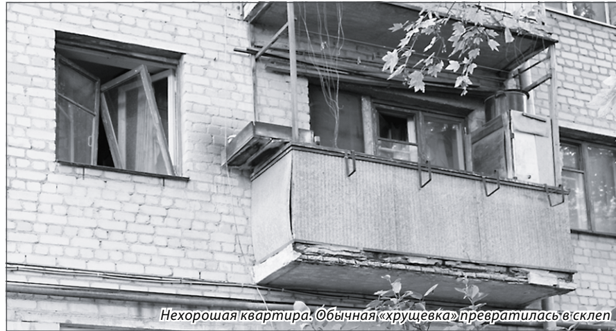
Нехорошая квартира. Обычная «хрущевка» превратилась в склеп

— Он делал все возможное, чтобы запаха не было, — говорит соседка «через стенку». — Открывал окна, проветривал, химикатами часто пахло из его окон.