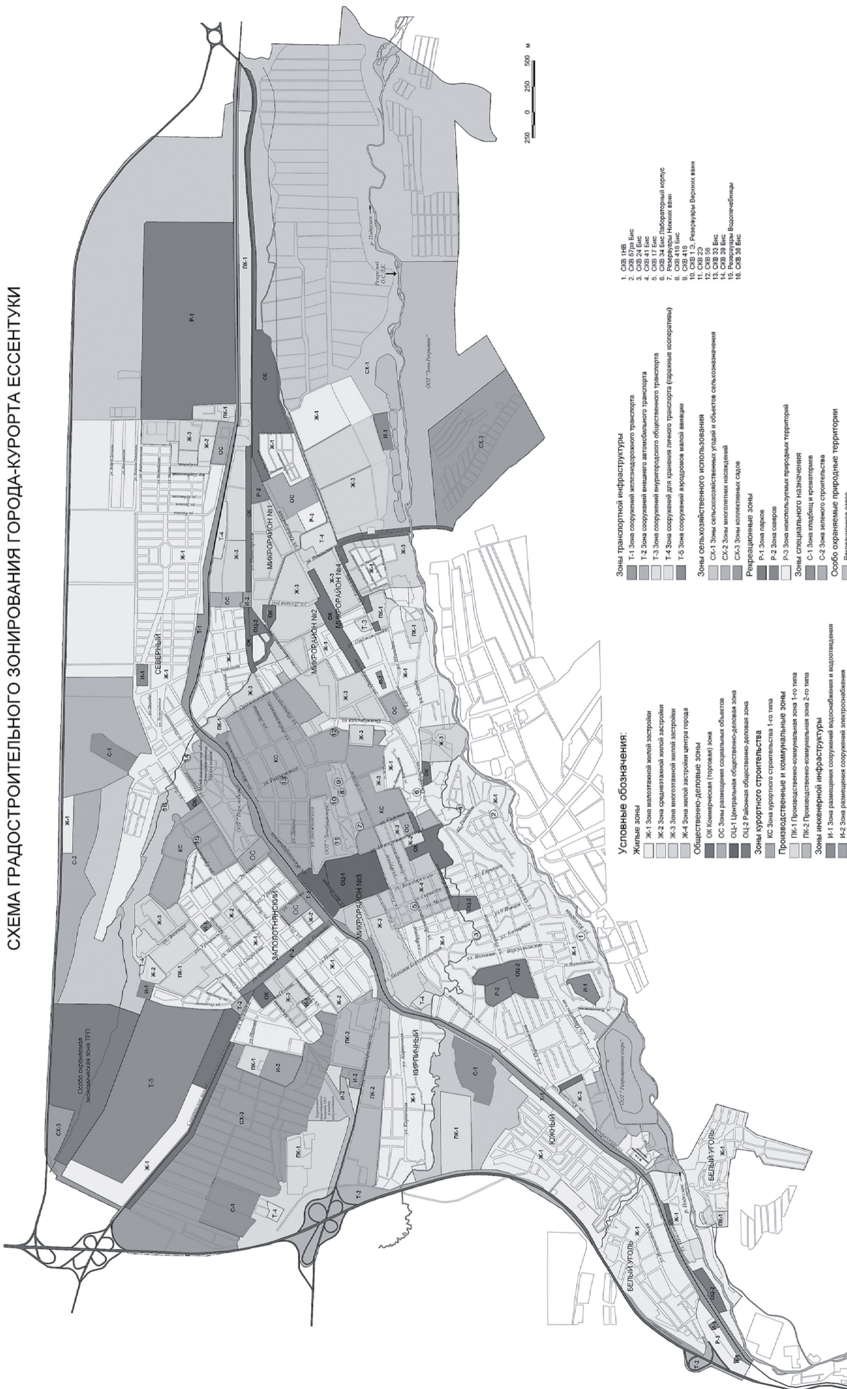
СХЕМА ГРАДОСТРОИТЕЛЬНОГО ЗОНИРОВАНИЯ ГОРОДА-КУОРТА ЕССЕНТУКИ

приложение 2 к Решению Совета города от _____ № _____