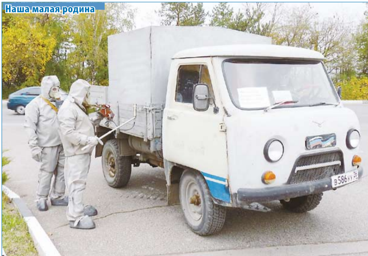
Тренировка по гражданской обороне в Эссентуках