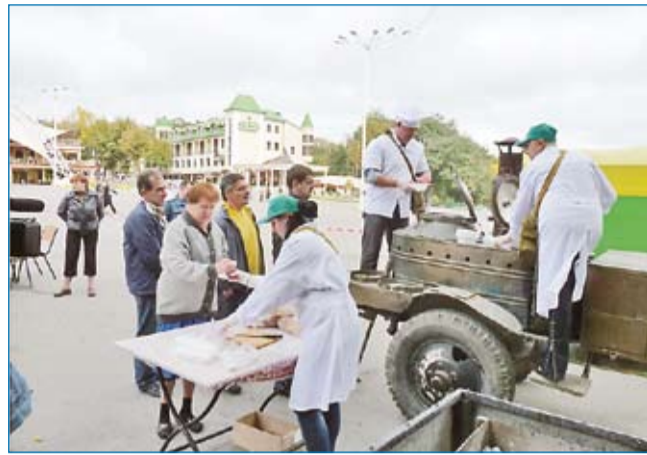
Раздача горячего питания на передвижном пункте

Последняя точка посещения проверяющих – пункт специальной обработки техники, развернутый на базе автомойки «Европа» на въезде в город. Это стало наиболее зрелищной частью учений – работа пункта проверяющим была продемонстрирована в режиме реального времени. На контрольно-распределительном пункте химико-разведчики и дозиметристы определяли зараженность автомобиля, он был отправлен на обработку в грязную зону дезактивирующим раствором, затем перешел в чистую зону для обработки водой. Снова проверка дозиметристами, после которой машина отправляется для дальнейшей эксплуатации.