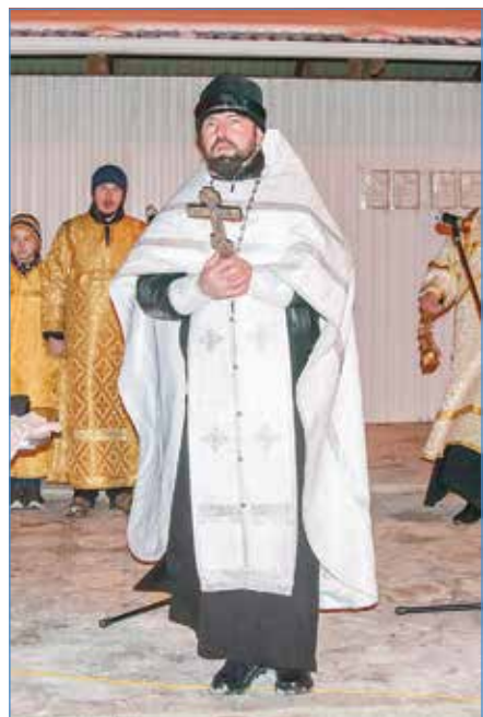
С тех самых пор существует традиция окунаться в освященные воды. Ессенту-

Крещение Господне – один из великих христианских праздников. Иначе эту дату называют Днем Богоявления. Согласно библейскому повествованию к Иоанну Крестителю на реку Иордан пришел 30-летний Иисус Христос, чтобы принять крещение.