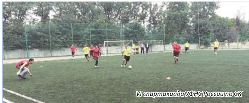
VI спартакиада УФНС России по СК

На сегодняшний день футбольное поле Центрального стадиона Эссентуков находится на реконструкции, но это совсем не помеха для спортсменов. Еженедельно они принимают участие в соревнованиях на выезде.