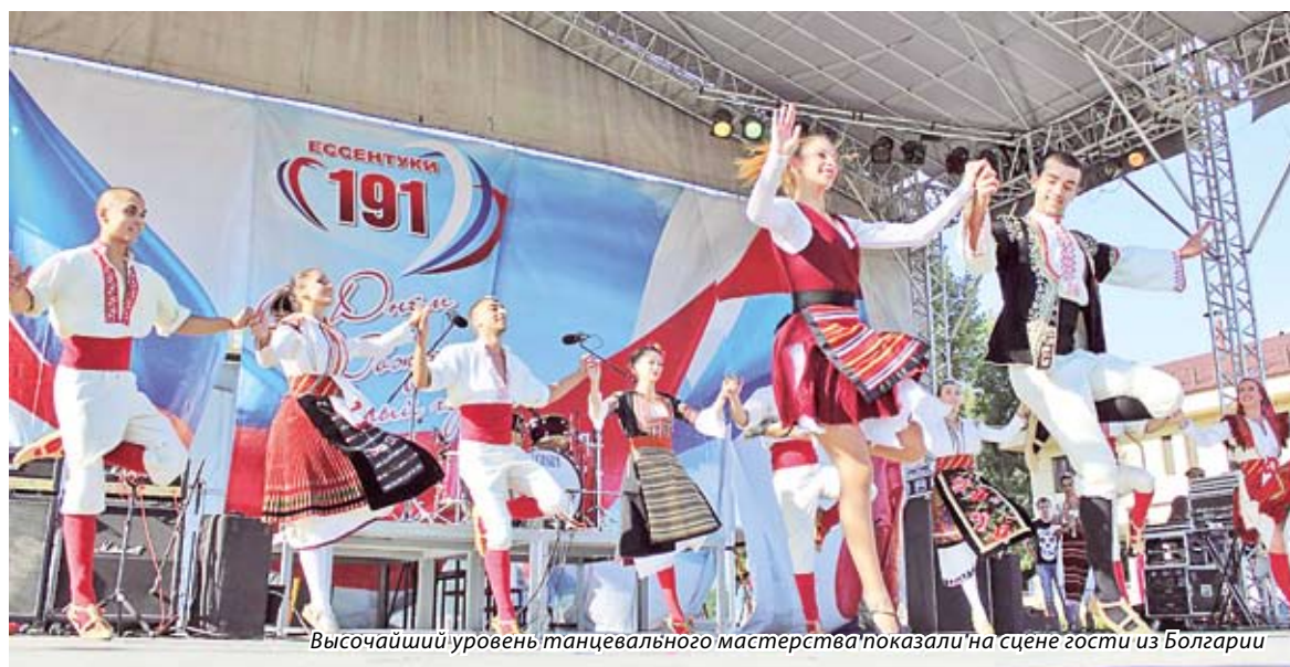
Высочайший уровень танцевального мастерства показали на сцене гости из Болгарии

Более тысячи человек, собравшиеся на Театральной площади курорта в День края, стали свидетелями незабываемого выступления ансамбля из Болгарии «National Art».