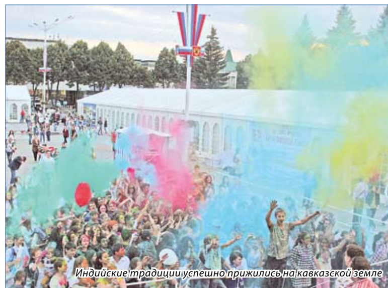
Индийские традиции успешно прижились на кавказской земле

– Это инвестиции в будущее. Если мы хотим получить высокооплачиваемую работу, то без диплома никак. Я поступила в медицинский колледж, и это только первый шаг в карьере стоматолога.