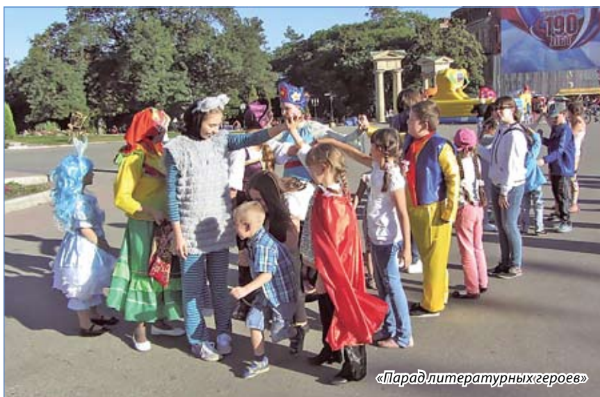
«Парад литературных героев»