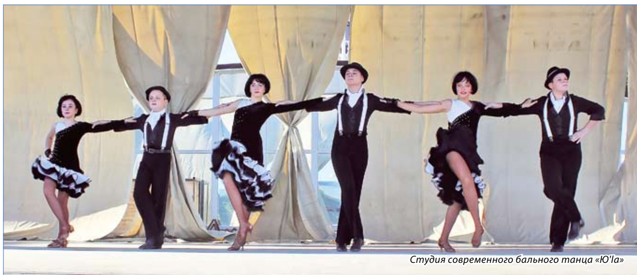
Студия современного бального танца «Ю'ла»

Ставрополье с размахом отметило День края. В Ессентуках праздничная программа была не такой обширной, как в краевой столице, но от этого не менее оригинальной и интересной. Юных гостей и жителей города развлекали тематические площадки, каждая со своей программой. Настоящим сюрпризом для малышей стал карнавал на Театральной площади. Здесь