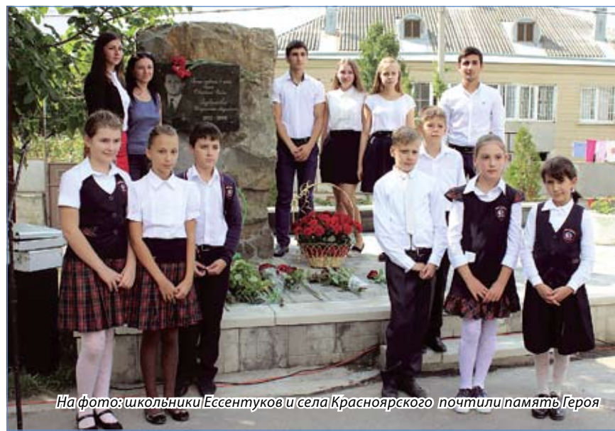
На фото: школьники Эссентуков и села Красноярского почтили память Героя