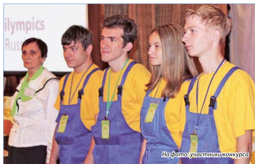
На фото: участники конкурса

Инвалиды, действительно, люди с ограниченными возможностями. Вот только ограничения ставит не болезнь, а общество. Непреодолима барьерная среда, проблемы с трудоустройством, самореализацией, отсутствие условий