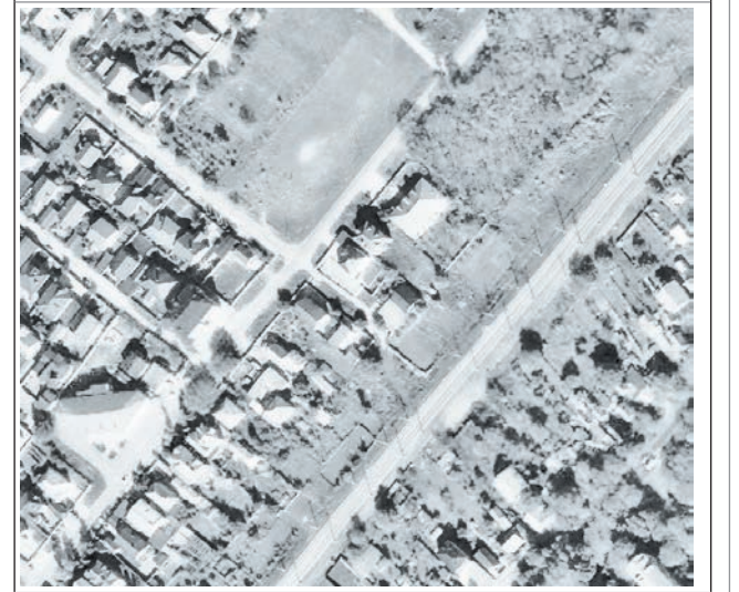
Схема с указанием территории, в отношении которой проводятся публичные слушания