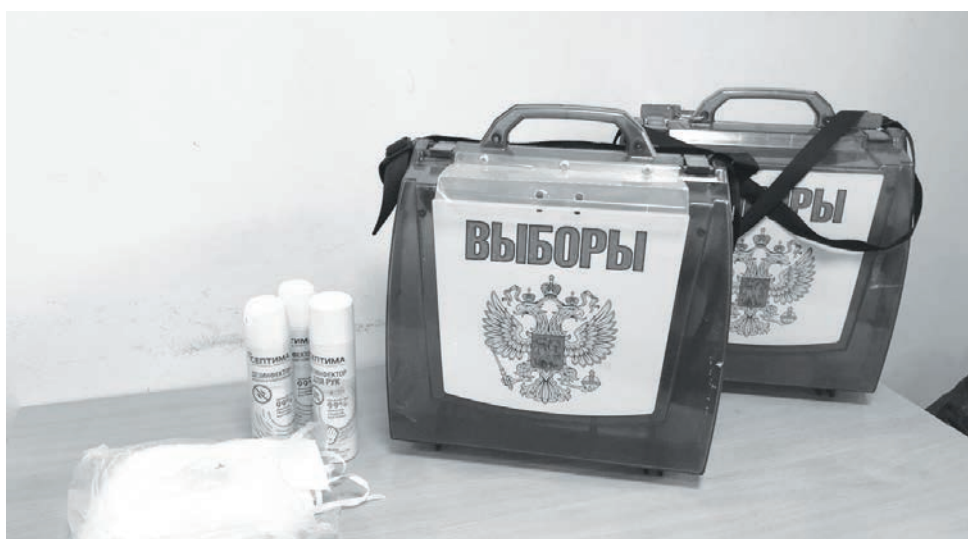
Фото июня 2020 г.