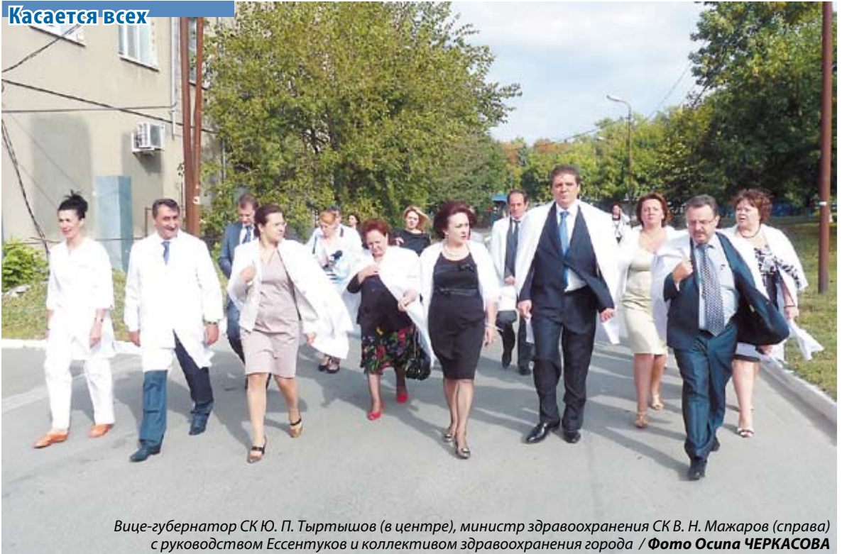
Вице-губернатор СК Ю. П. Тыртышов (в центре), министр здравоохранения СК В. Н. Мажаров (справа) с руководством Ессентуков и коллективом здравоохранения города