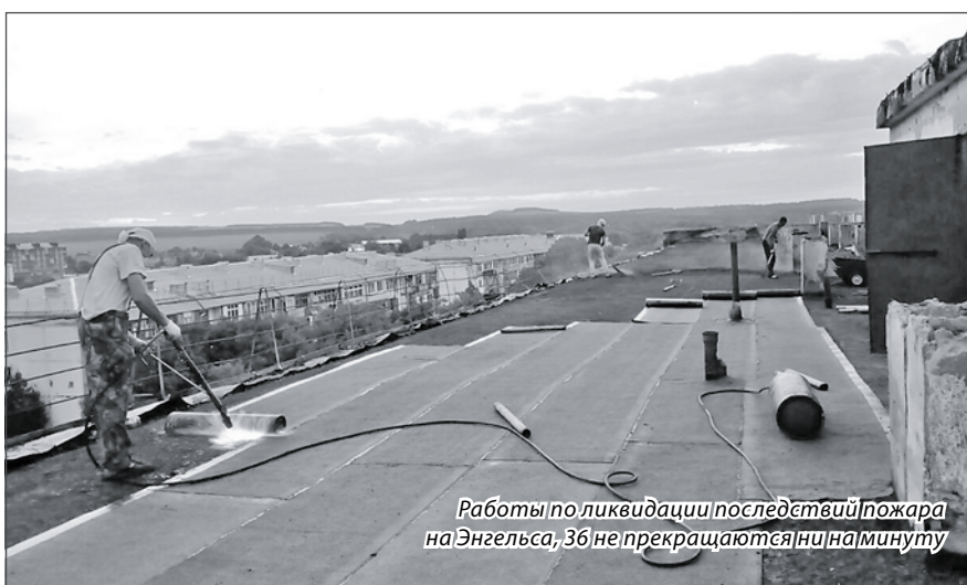
Работы по ликвидации последствий пожара на Энгельса, 36 не прекращаются ни на минуту

– С крыши демонтировано порядка 20 тонн остатков предыдущей кровли. Выполнено устройство временного мягкого покрытия и герметичная за-