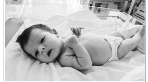
По информации отдела опеки и попечительства администрации г. Ессентуки