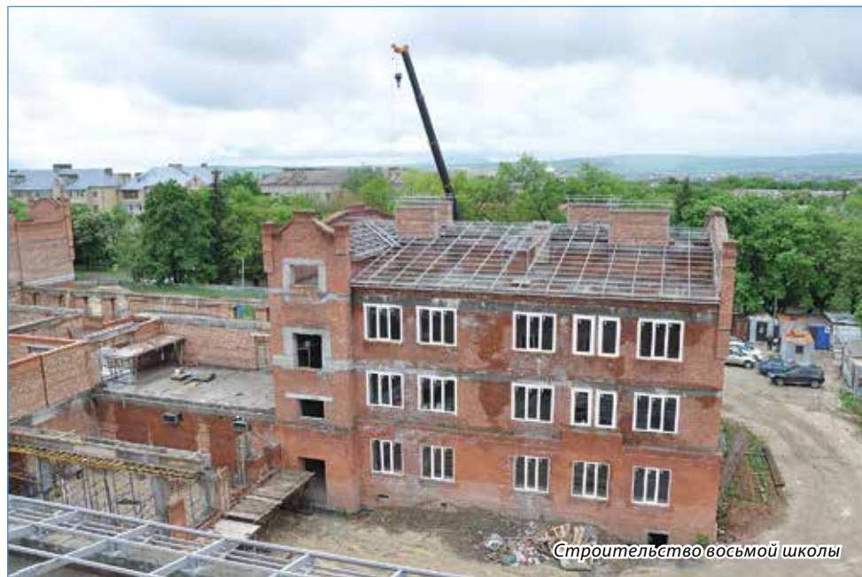
Строительство восьмой школы