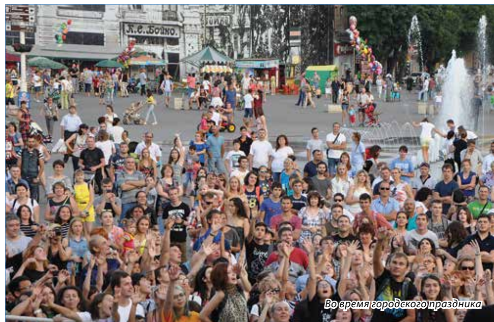
Во время городского праздника

Мы любим Ессентуки за целебные воды и уютные парки. За тихие скверы и улочки, где нам знаком каждый камень, и памятники, известные всей стране.