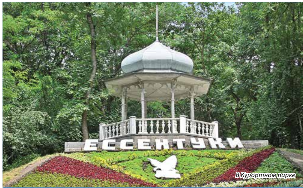
В Курортном парке

Придание статуса исторического поселения включает разработку типовых фасадов для застройщиков в традиционной для города архитектуре. Границы исторического поселения могут не совпадать с границами города. Акцент будет сделан на сохранение исторического центра с Ле-