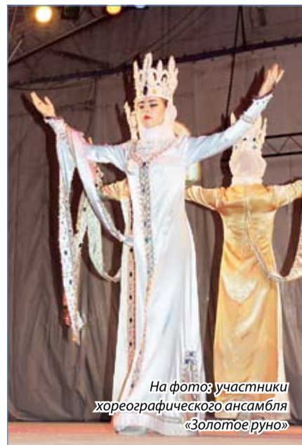
На фото: участники хореографического ансамбля «Золотое руно»