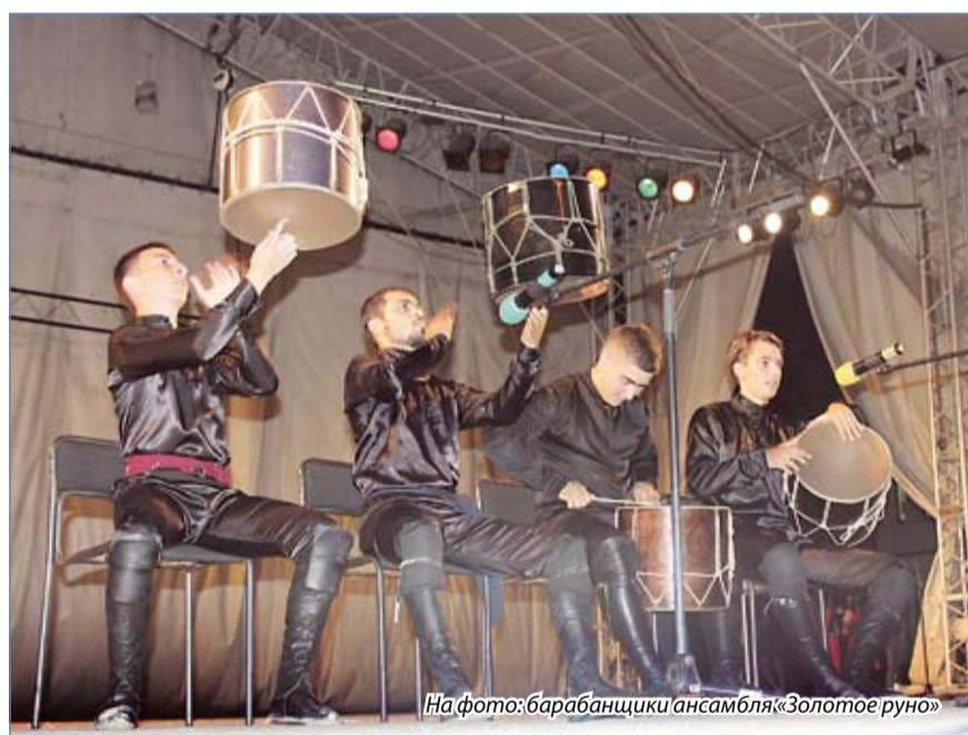
На фото: барабанщики ансамбля «Золотое руно»

В мае танцевальный коллектив «Золотое руно» уже давал сольное выступление. Но капризная весенняя погода не позволила в полной мере насладиться зрелищем, и, как говорится, по многочисленным просьбам зрителей, в минувшую субботу у ессентучан и гостей курорта вновь появилась возможность лицезреть хореографический ансамбль во