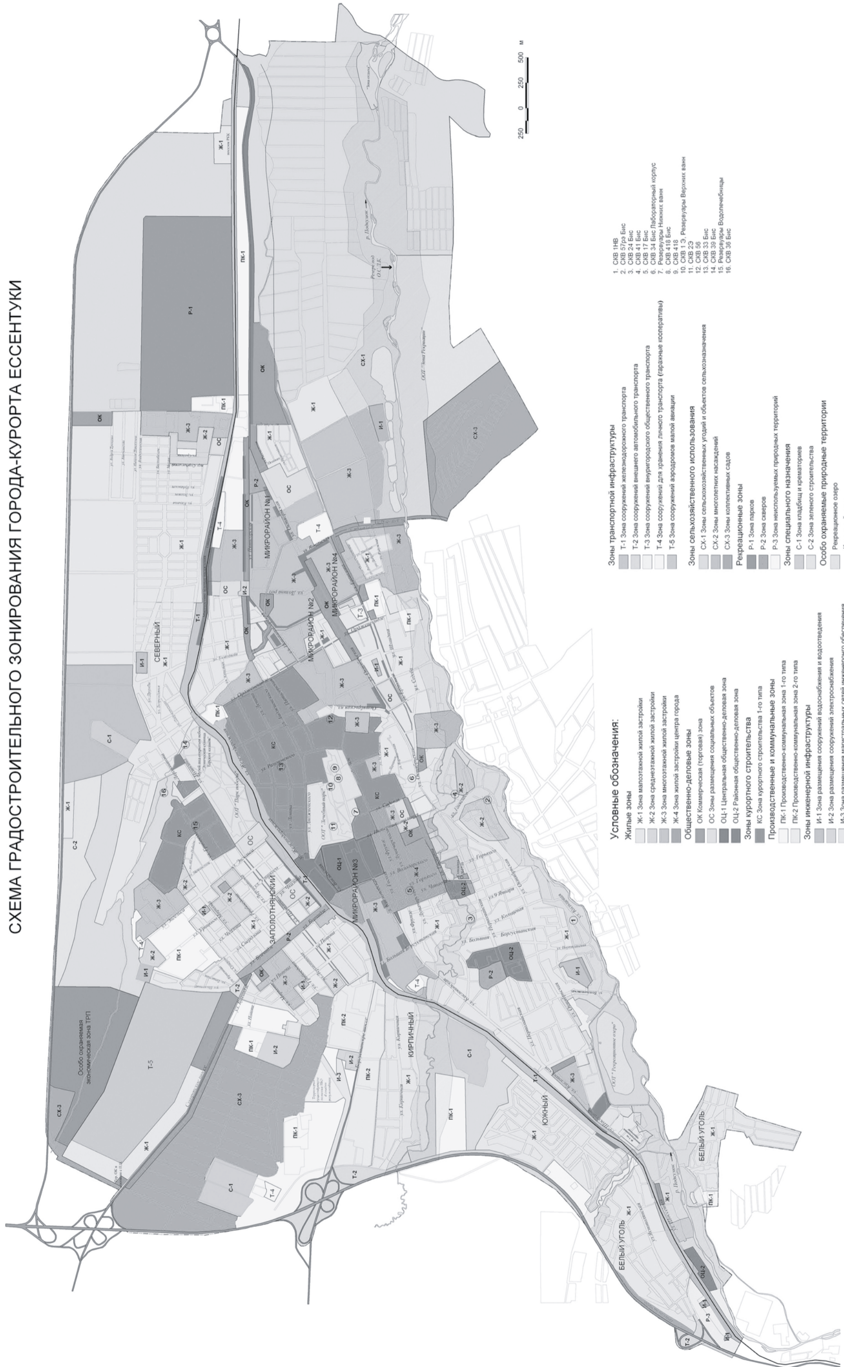
СХЕМА ГРАДОСТРОИТЕЛЬНОГО ЗОНИРОВАНИЯ ГОРОДА-КУОРТА ЕССЕНТУКИ

приложение 2 к Решению Совета города от 30.07.2014 № 69