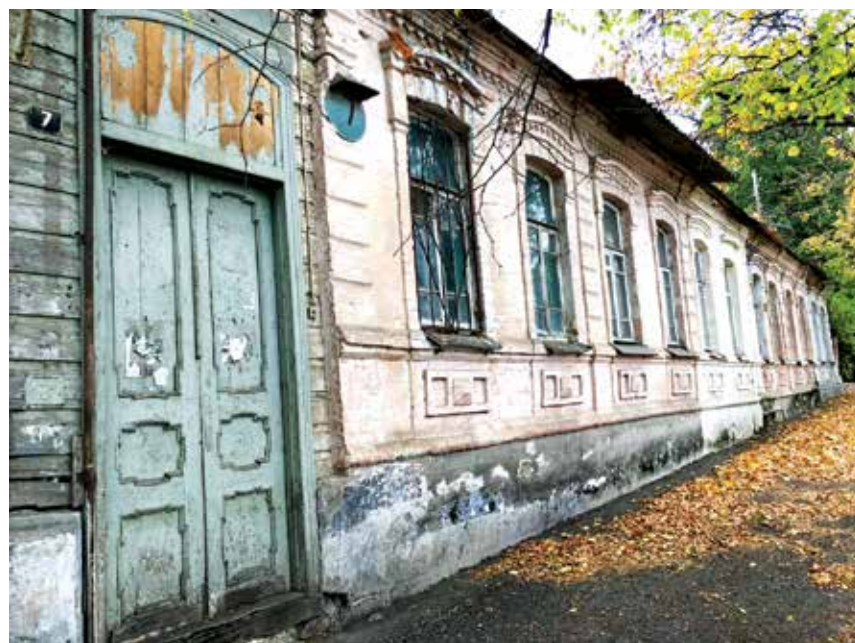
Архив 2020 год

Территориями-участниками программы являются Ессентуки, Кировский городской округ, Пятигорск, Невинномысск.