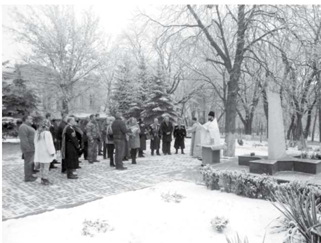
Архив 2019 года

Ежегодно потомки казаков собираются у мемориального комплекса на территории Пантелеимоновского храма Эссентуков и вспоминают жертв репрессий.